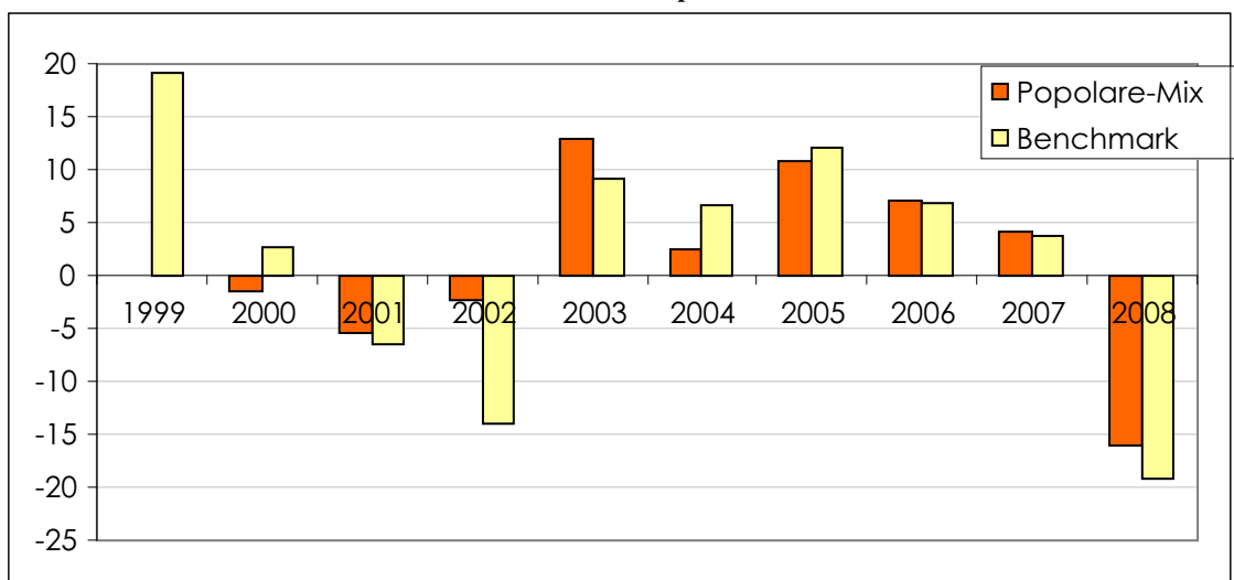
Rendimento annuo del Comparto e del benchmark

Il rendimento del comparto e del benchmark sono riportate al netto degli oneri fiscali.